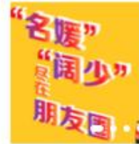
朋友圈47%的内容在炫耀