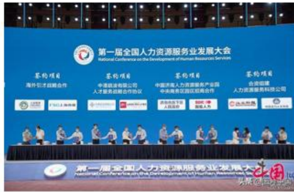
人力资源服务供需对接项目签约仪式

从2010年起，人力资源社会保障部和相关省市陆续建成上海、重庆、苏州、杭州、广州等22家国家级人力资源服务产业园。截至2020年底，各国家级产业园已有入园企业超3500家，营业收入2700亿元，成为当地经济社会发展的一大亮点。截至2020年底，全国共有各类人力资源服务机构4.58万家，从业人员84.33万人，设立固定招聘（交流）场所4.2万个，建立人力资源市场网站1.8万个。