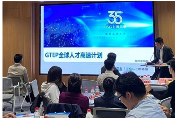
上海外服现场介绍“GTEP全球人才高速”。

“GTEP全球人才高速计划”（Global Talent Express Plan）由上海外服和临港新片区共同搭建，是为临港新片区吸引和发展海外人才打造的一站式服务平台，旨在依托临港新片区的产业影响力、客户资源，以及上海外服的国际化网点，为临港新片区发展提供海外人才智力支撑。通过上海外服覆盖美国、德国、法国、意大利、匈牙利、新加坡、日本、马来西亚、泰国、澳大利亚、中国香港、中国澳门等12个国家和地区的人才快线，“GTEP全球人才高速计划”将围绕人工智能、生物医药、集成电路、航空航天4个重点产业人才，打造海外人才政策平台、海外人才智库平台、海外人才网络平台、海外人才创业发展平台、海外人才职业服务平台、海外人才乐业服务平台6大平台功能，全面实施引才计划、用才计划和留才计划。同时，还将为各类企业和海外人才提供国际化人才课题研究及发布、国际人才引进及发展、国际青年实习生交流、留学人员创业储备等服务。