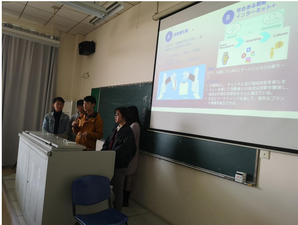
《日本经济与贸易（日）》课堂讨论现场